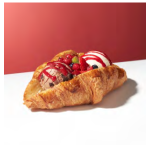
クロワッサン with “バニラ”&“チョコレートブラウニー” 600円

チョコレートチップを練り込んだパンに食感の楽しいクッキー&クリームアイスクリームを挟み、上から香ばしいローストアーモンドをぜひたくに盛り付けました。