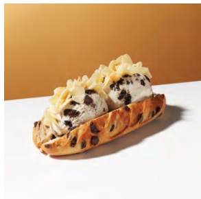
ヴィエノワーズショコラ with “クッキー&クリーム” 600円

カカオのほろ苦さと中はモチモチ・外はカリカリの口当たり。コク深いマカデミアナッツアイスクリームに合わせて、隠し味に香り広がるココナッツを増量した特別なレシピのパンでお届けします。