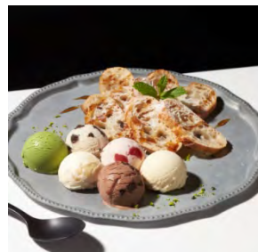
バゲットモンジュ with Häagen-Dazs 1,300円 (セット：1,500円)

ブルーベリーを練り込んだしっとりモチモチの天然酵母パンと果肉たっぷりのストロベリーアイスクリームの2つの甘酸っぱさが広がります。ベリーと相性のいいクリームチーズとピスタチオを添えて。