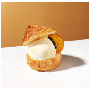
クロワッサンハット with “バニラ” 600円

濃厚なバニラアイスクリームをレモンピールの香り広がるプリオッシュにのせ、ザクザクのクロワッサンの帽子をかぶせました。