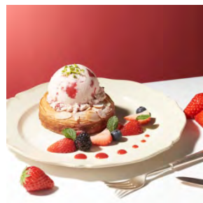
デニッシュ with “ストロベリー” 1,100円 (セット：1,300円)

バター風味豊かなデニッシュにカラメルソースをコーティングしたクイニアマンで、バニラアイスクリームをぜひたくに挟みました。リンゴのソテーが2つの味を引き立てます。