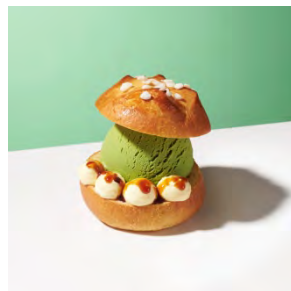
ブチプリオッシュシュクル with “グリーンティー” 600円

ホワイトチョコレートを練り込んだ人気のデリスブランに香り豊かなストロベリーアイスクリームの甘酸っぱさが口に広がります。