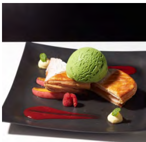
ショソンオボム with “グリーンティー” 1,300円 (セット：1,500円)

カスタードクリームを包んで焼き上げた香ばしいデニッシュの上に、イチゴソースと香り豊かなストロベリーアイスクリームをのせました。重なり合う甘酸っぱさが口の中でとろける一品です。