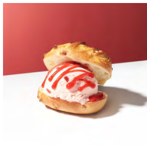
デリスブラン with “ストロベリー” 600円

濃厚なバニラアイスクリームをレモンピールの香り広がるプリオッシュにのせ、ザクザクのクロワッサンの帽子をかぶせました。