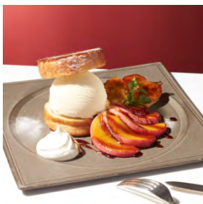
クイニアマン with “バニラ” 1,000円 (セット：1,200円)

ラムシロップに漬け、香ばしいアーモンドクリームを挟み焼き上げたクロワッサンに濃厚なバニラアイスクリームが絡み合います。最後にベリーもふんだんに散りばめて。