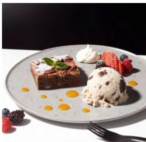
ホットブラウニー with “クッキー&クリーム” 1,000円 (セット：1,200円)

しっとりふわふわ焼きたてのフレンチトーストに、ローストバナナとチョコレートブラウニーアイスクリームの濃厚でコクのある味わいが広がります。