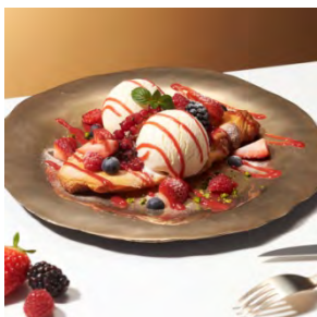
クロワッサンオザモンド with “バニラ” 1,300円 (セット：1,500円)

ラムシロップに漬け、香ばしいアーモンドクリームを挟み焼き上げたクロワッサンに濃厚なバニラアイスクリームが絡み合います。最後にベリーもふんだんに散りばめて。